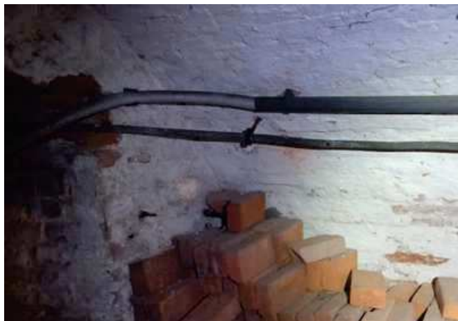
FOT.: WYJŚCIE WLZ ZE ZŁĄCZA KABLOWEGO (piwniece północna ściana nawy zachodniej)