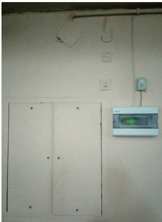
FOT.: CHÓR - ROZDZIELNICA ORGANÓW I ROZDZIELNICA STEROWANIA PRACĄ DZWONÓW Dariusz Kędziora sierpień 2023