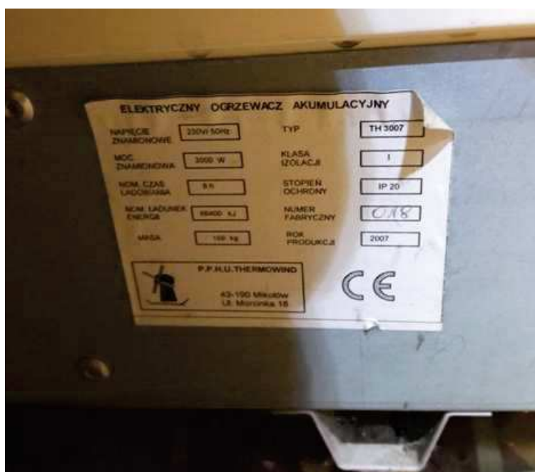
FOT.: TABLICZKA ZNAMIONOWA OGRZEWACZY AKUMULACYJNYCH