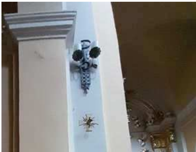
FOT.: KINKIET PODWÓJNY W NAWIE GŁÓWNEJ Tomasz Soćko czerwiec 2023