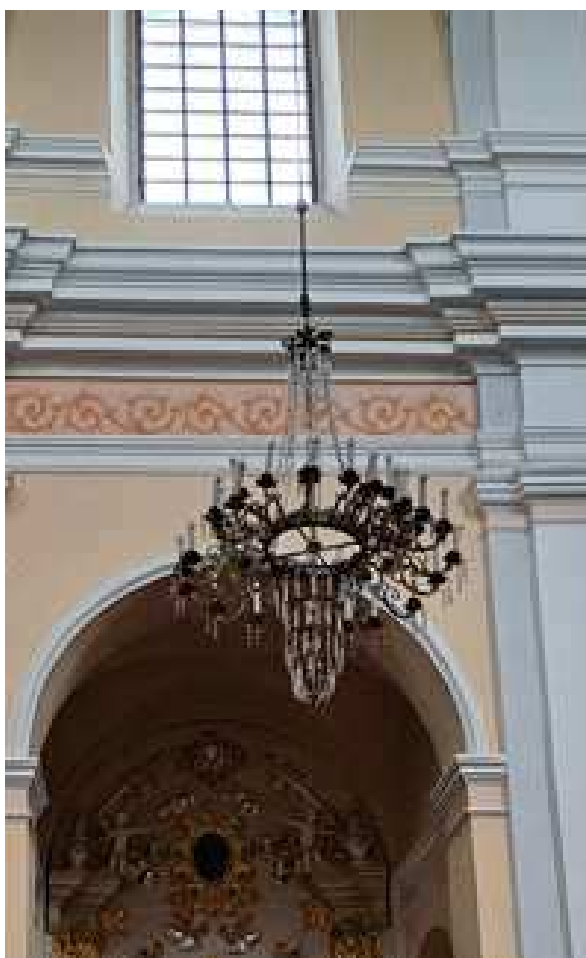
FOT.: NAJWIĘKSZY ŻYRANDOL W NAWIE GŁÓWNEJ (zasilanie strychem) Tomasz Soćko czerwiec 2023