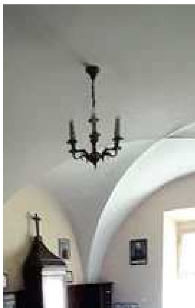
FOT.: ŻYRANDOL W ZAKRYSTII ZACHODNIEJ Tomasz Soćko czerwiec 2023