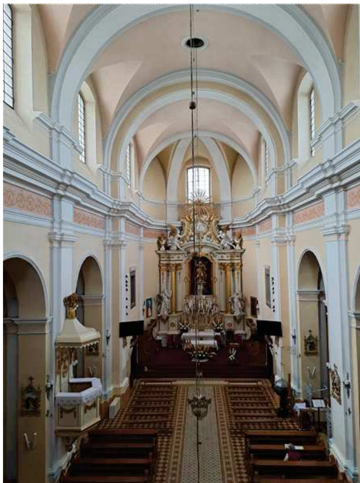
NAWA GŁÓWNA (widok z chóru, zasilanie 4 żyrandoli strychem) czerwiec 2023