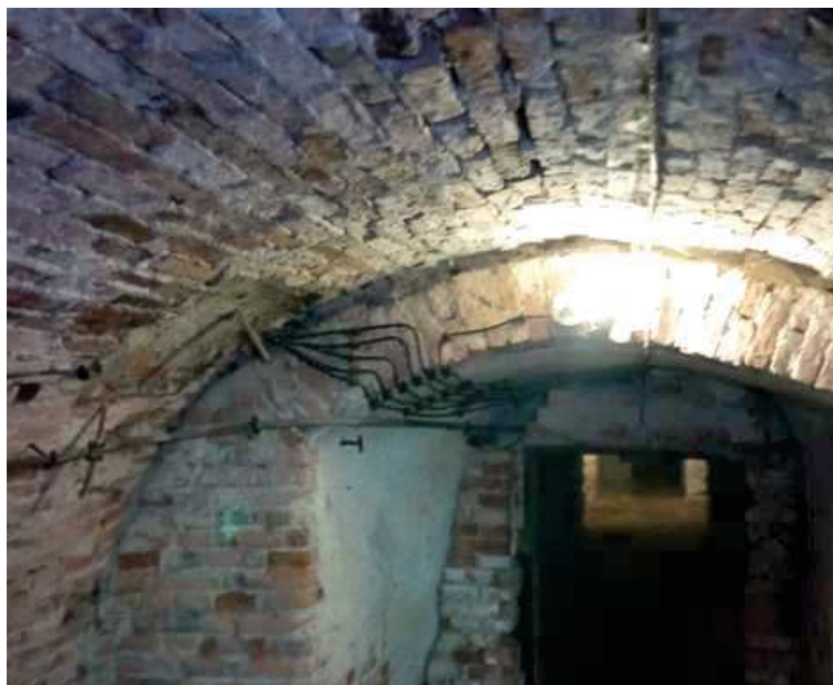
FOT.: PRZEWODY Z ROZDZIELNICY GŁÓWNEJ NA INSTALACJĘ ODBIORCZĄ (grzejniki elektryczne w nawach bocznych, oświetlenie podziemi)