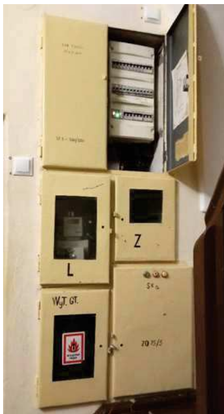
FOT.: ROZDZIELNICA GŁÓWNA KOŚCIOŁA (parter zakrystii zachodniej)